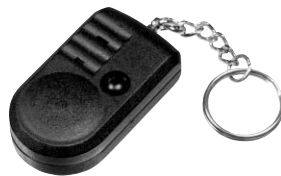
Рис. 1. Внешний вид приемника

После того, как вы услышали тревожный сигнал и определили тип тревоги, нажмите кнопку на корпусе приемника, чтобы сбросить индикацию. Эта же кнопка используется для управления работой приемника.